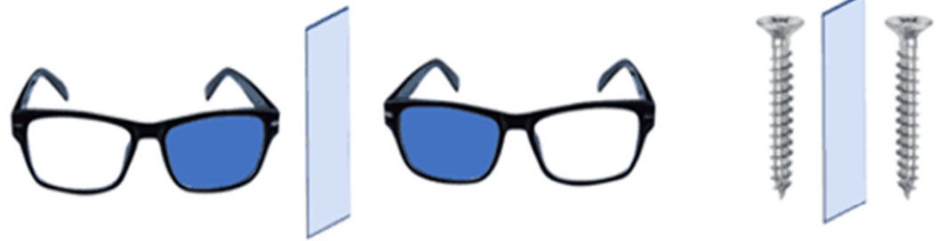
chiral - nonsuperimposable