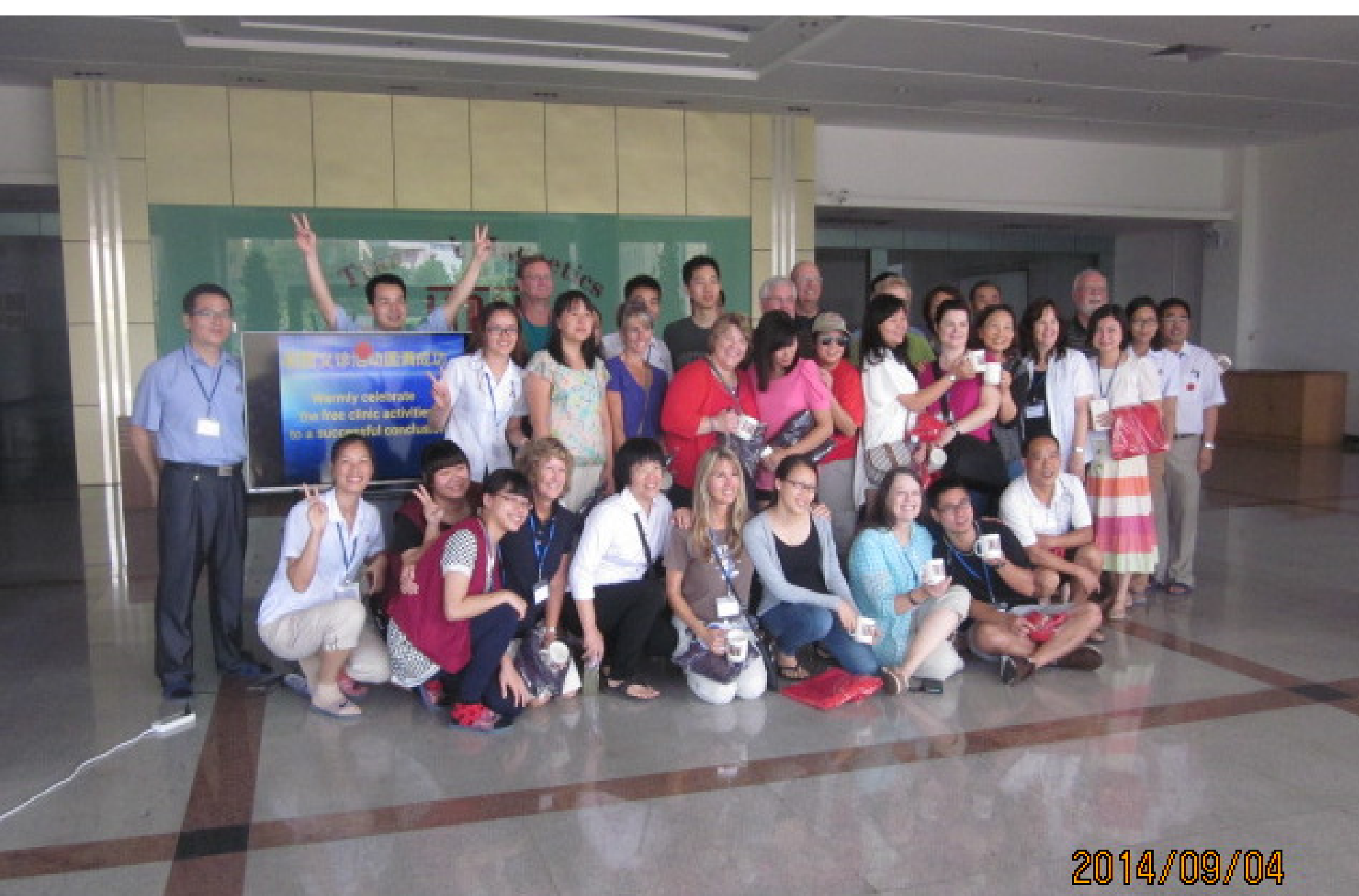
9/1-9/4/2014 廣東工廠義診宣教圖片